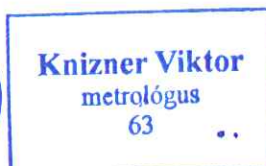
Knizner Viktor metrológus